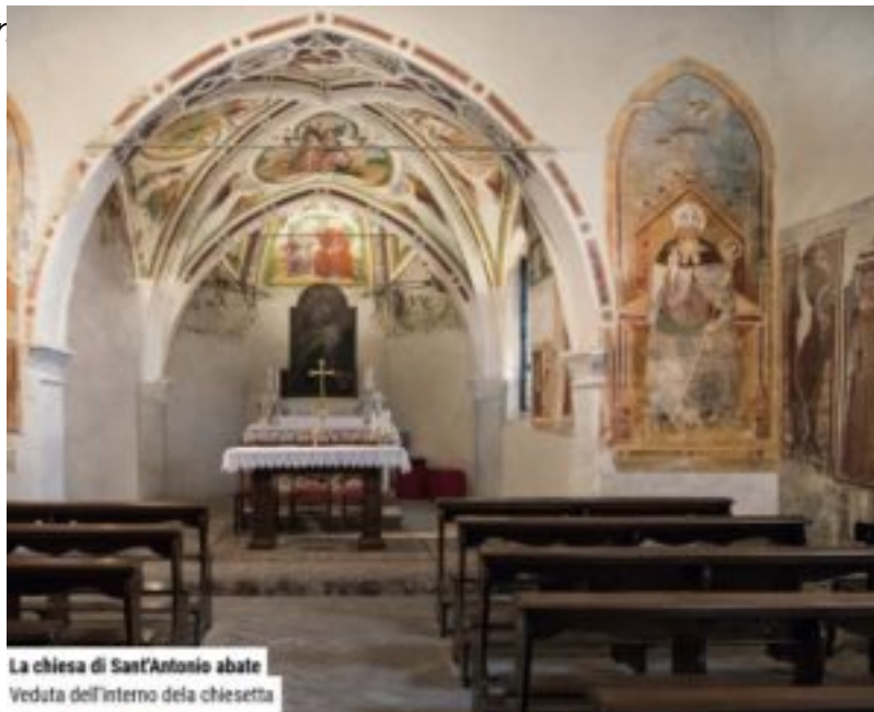
La chiesa di Sant'Antonio abate Veduta dell'interno della chiesetta

All'esterno, gli affreschi trecenteschi presentano la Madonna in trono che allatta il Bambino , Sar