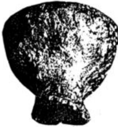
Fig.3 - Vasetto a coppa. Da G. Marzolini., R. Paparella 1982-86:143.

Il tratto iniziale della cavità fu scavato negli anni settanta dal GRPU dell'Associazione XXX Ottobre. In quell'occasione portarono alla luce materiale romano e dei castellieri.