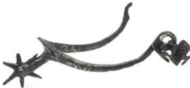
Pulfero, Castello di Biacis.

Nelle vicinanze, si trovano anche i resti di un'imponente muraglia, lunga duecento metri e larga due alla base, indicata da alcuni studiosi come parte di un'opera di sbarramento della vallata del sottostante Natisone, simile alla chiusa di Ponte S. Quirino, le cui pietre sarebbero state riutilizzate per edificare gli edifici delle sottostanti frazioni, a partire da Biacis, che, in tempi medievali, avrebbe costituito una centa (ovvero un borgo fortificato), come sembrerebbe dalla dislocazione e struttura delle case più antiche della borgata. All'interno della cerchia della centa è stato recuperato un antico edificio in cui è stato ricavato, a cura di un centro culturale della zona, un interessante esempio di locanda, sempre del periodo alto medioevo.(E.P.)