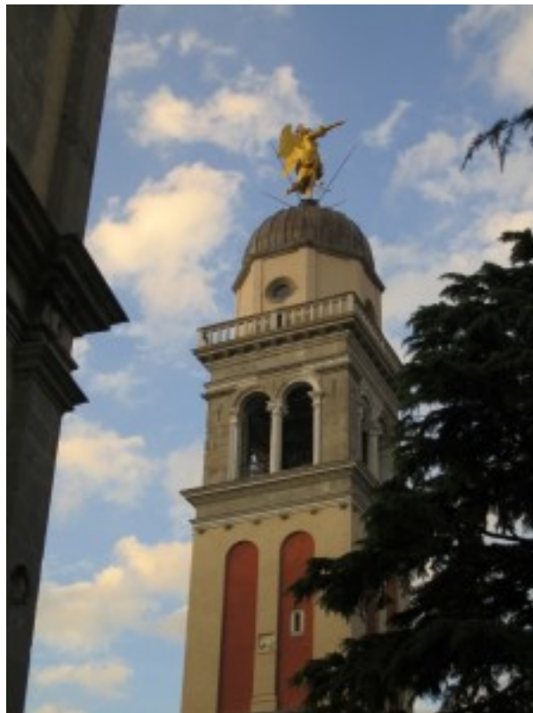
IL CAMPANILE DELL'ANGELO

Nella parete della navata di sinistra, staccato dalla chiesa di San Giusto a Premariacco, vi è l'affresco raffigurante San Giusto e San Michele , databile al 1445. L'affresco successivo, con il Martirio di San Lorenzo cui si sovrappone un riquadro con Santi e Madonna con Bambino , è quasi illeggibile.