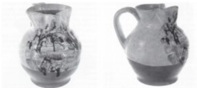
Figura 3. Il boccale dopo il restauro. Veduta frontale. Figura 4. Il boccale dopo il restauro. Veduta laterale.