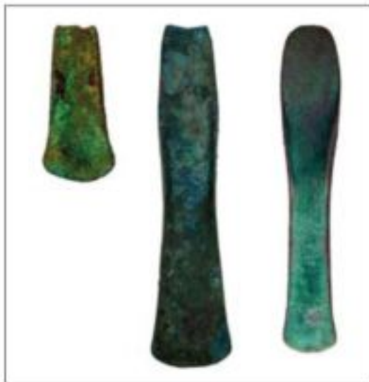
Fig. 10. Asci protostoriche in metallo recentemente rinvenuti nel Savitese: 1. Ascia in rame da S. Giovanni loc. Sedùlis; 2. Ascia in bronzo da Sisto al Righina loc. Melmosa; 3. Ascia in bronzo ad alette mediane da S. Giovanni loc. Sedùlis.

Rossi 2006 sito CD27, CD35; Tasca, Destefanis, Villa 2003 sito n. 16; corrisponde approssimativamente al sito 53 di Destefanis 1999.