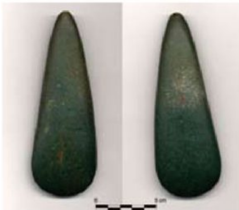
Fig. 7. Ascia neolitica in pietra levigata da loc. Teghine (Immagine Museo Civico di San Vito, elab. G. Tasca).

Si raccolgono qui due siti, posti a breve distanza e con evidenze analoghe: Sedulis Nord e Sedulis Fornace.