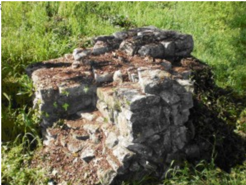
Fig. 5 Incrocio di muri sull'angolo sudoccidentale, visto da nord.

Sul muro orientale, dinanzi all'attacco dell'abside, rimane il basamento quadrato (lato cm 56) di un pilastro. Esso doveva sostenere l'arcone che collegava l'abside con questo vano (fig. 6). Lo spiccato si trova, alla base, a una quota elevata sull'attuale piano di campagna. Ciò significa che il livello di età tardoantica qui era più alto.