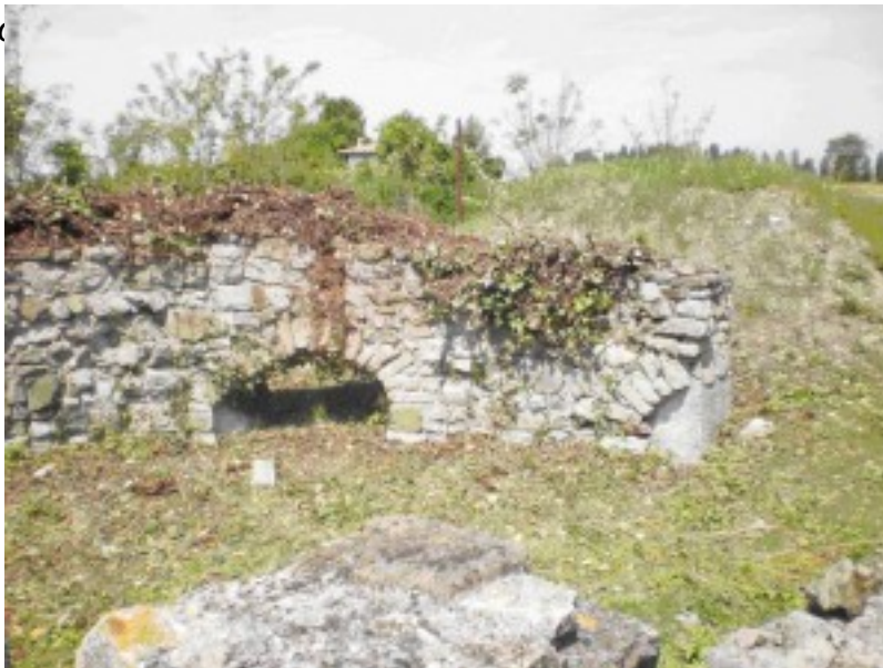
Fig. 3. Veduta da sud dell'abside.

Se ne ricava che al triclinio di un edificio più antico, forse esistente ancora nel II sec. d. C. venne aggiunta, forse nel III o al più tardi nel IV secolo d. C., un'abside.