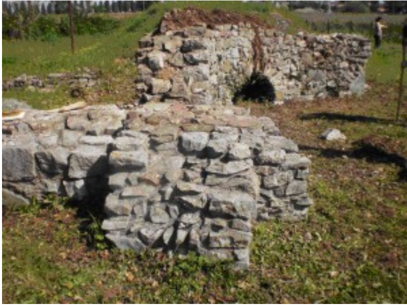
Fig. 4. Incrocio