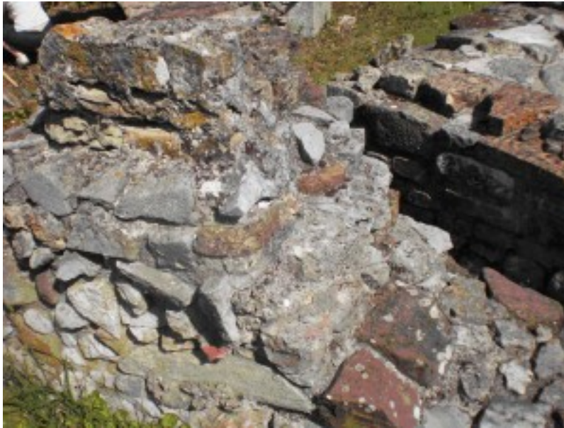
Fig. 6. Basamento del pilastro orientale dell'arcone che incorniciava l'abside. In secondo piano parte del triangolo delle mura a zigzag che più a est sormonta il muro della casa.

Dell'edificio, che dobbiamo dunque interpretare come residenza signorile usata anche in età tardoantica, rimane ben poco. Sono stati completamente asportati i pavimenti, manca l'intonaco, forse affrescato e via dicendo. La pianta e le dimensioni dello spazio centrale, che interpretiamo come triclinio, corrispondono appieno alla pianta della casa meridionale del fondo C.A.L. (fig. 7).