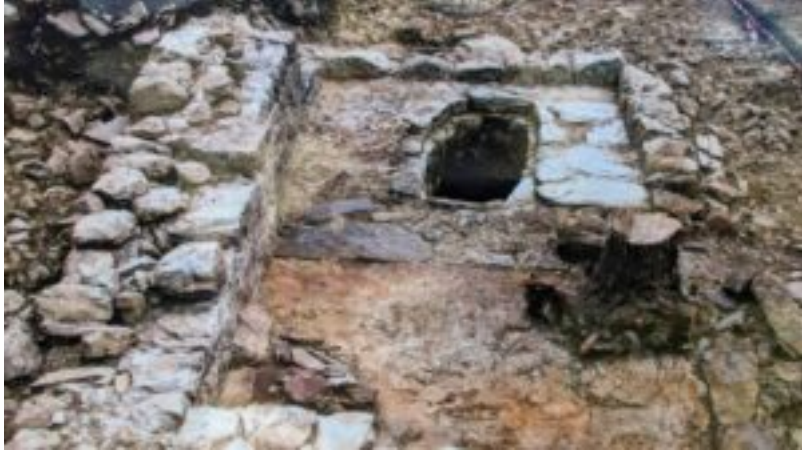
Base di un forno