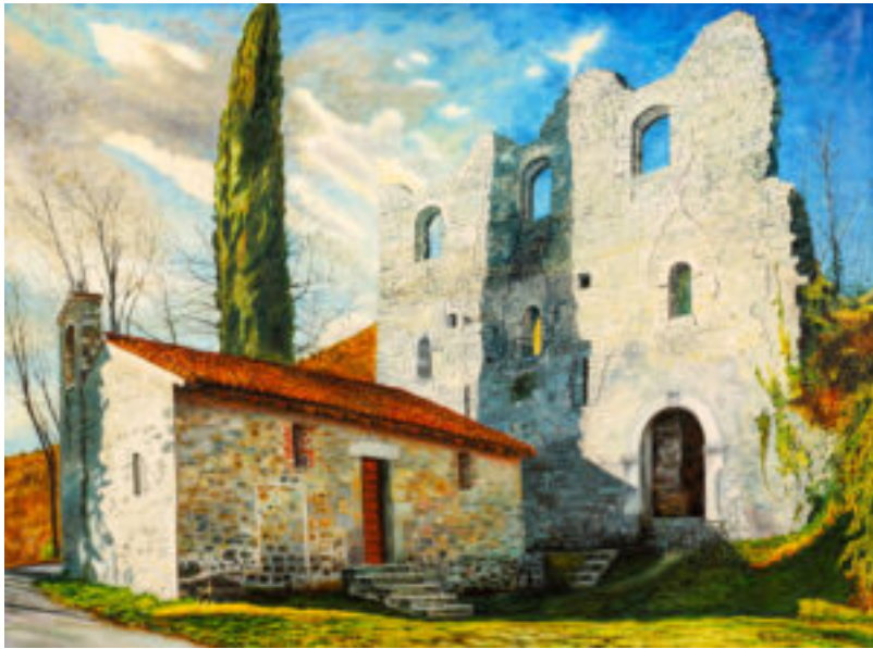
Dipinto di Raffaello De Gottardo ( https://www.ilfotomatico.com/pordenone-castelli-libro/ )

Il castello di Maniago subì diversi assedi: il più antico nel 1216, altri nel corso del XIV secolo, l'ultimo nel 1420, quando la Repubblica di Venezia, determinata a conquistare il Friuli, costrinse i maniaghesi alla resa firmata il 5 giugno dello stesso anno dal nobile Bartolomeo di Maniago. Il violento terremoto che colpì la regione nel 1511 danneggiò anche il maniero maniaghese compromettendone le strutture ? verosimilmente non più riattate ? e portando così all'abbandono del castello, avvenuto nei primi decenni del XVII secolo.