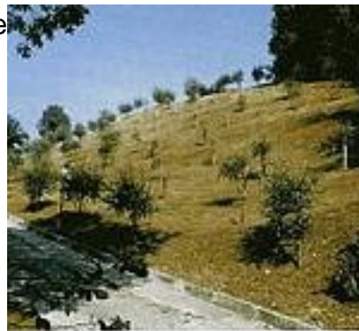
"Zucule" sul quale è stato realizzato nell'età del bronzo il castelliere

Ludovico Quarina, che per primo ha censito i castellieri e le tombe a tumulo del Friuli, colloca questi manufatti, ritenuti del popolo degli Euganei, tra la fine dell'età del bronzo e la prima età del ferro.