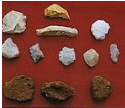
Si è ceramiche del neolitico provenienti dall'area esterna della "Zucule"

zione di Studi Preistorici del Centro di Antichità Altoadriatiche ha condotto in loco alcuni saggi di scavo che hanno confermato la presenza dell'uomo in età preistorica. Tra i ciottoli del materasso ghiaioso si sono infatti rinvenuti, misti a terra nera, frustoli di ceramica d'impasto e frammenti di vasi. Le caratteristiche di questa ceramica suggeriscono la possibilità che il castelliere di Rive d'Arcano s'inquadri nella fase tarda dell'età del bronzo, epoca in cui sono tutt'altro che rari gli insediamenti su alture naturalmente fortificate.