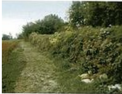
Aggere di chianura a nord del Castelliere di Rive d'Arcano.

Collocato su un elevato terrazzo morenico inciso dalle valli confluenti del torrente Petòc e del Corno, in favorevole posizione rispetto alla sottostante pianura, il Castelliere di Rive d' Arcano detto "della Zucule" (superficie interna di 3,6 ettari e perimetro di m. 840) è uno straordinario documento dei primi insediamenti umani del territorio durante l'età del bronzo e delle prime fasi della successiva età del ferro. Sul lato settentrionale, non difeso dal ripido declivio del terreno, è stato innalzato un aggere artificiale rettilineo alto circa 5 metri e lungo 160 nei pressi del quale si sono rinvenuti cocci ed oggetti di bronzo.