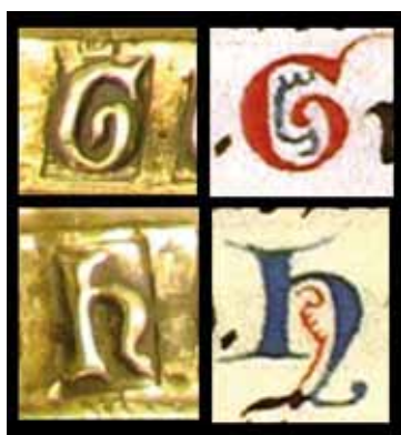
FIG. 5. Confronto tra le lettere punzonate sulla tabula e quelle miniate sul Salterio di S. Elisabetta (cod. CXXXVII – Museo Archeologico di Cividale del Friuli).

fronti paleografici. La maiuscola 'A' ad esempio, punzonata ben 54 volte sulle lastre metalliche è stata confrontata con la medesima adoperata in alcuni fogli del Salterio di Santa Elisabetta (ff. 35r e 82v [capoversi decorati], ma soprattutto ff. 104r, 118r e 164r) con il risultato, singolare, che in entrambi i casi il carattere epigrafico risulta fortemente squadrato, con una decisa chiusura del tratteggio superiore che fuoriesce palesemente dai confini lineari del carattere e va a formare, a sinistra, una vigorosa protuberanza triangolare (fig. 3). La somiglianza tra i caratteri è evidente. Il medesimo risultato si è avuto con altri confronti questa volta effettuati con le lettere G, H, E ed X la cui fattura viene riprodotta similmente nel codice e sulla tabula (figg. 4-5). Accertato che non esistono altri esempi di iscrizioni su opere d'arte simili a quelli realizzate a Cividale e valutate le palesi corrispondenze con il codice membranaceo cividalese n. CXXXVII, si possono proporre alcune considerazioni.