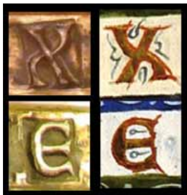
FIG. 4. Confronto tra le lettere punzonate sulla tabula e quelle miniate sul Salterio di S. Elisabetta (cod. CXXXVII – Museo Archeologico di Cividale del Friuli).