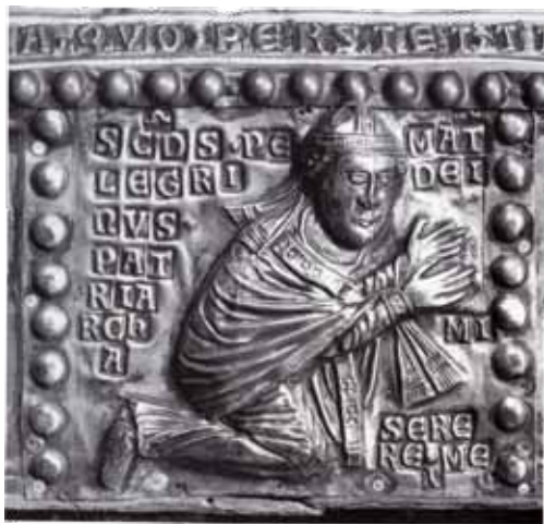
FIG. 2. Particolare della formella con il patriarca Pellegrino II.

MATER DEI e S(AN)C(TU)S GABRIEL ; nei comparti laterali esse aiutano nell'identificazione altrimenti difficile dei venticinque personaggi raffigurati, apostoli, vescovi e santi; infine, sulla cornice, troviamo una sola iscrizione nella formella che ritrae Pellegrino II e che riporta, oltre al titolo del presule, la biblica invocazione di perdono ispirata al Salmo 51: SCDS PELEGRINUS PATRIARCHA – MAT(ER) DEI MISERERE MEI (fig. 2). Per quest'ultima iscrizione è necessario un breve chiarimento, viste le eclatanti irregolarità riscontrate nei contributi più recenti. La maggior parte degli studiosi che ha analizzato l'opera cividalese con-