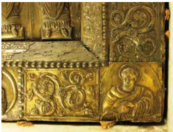
FIG. 12. Particolare della 'pala' nella teca marmorea dell'altare maggiore con discutibili cunei lignei addossati alle formelle.

Ciò detto, si auspicano per quest'opera nuove analisi e studi anche mediante l'utilizzo di strumentazioni tecniche più avanzate affinché sia possibile valutare con maggiore precisione tutte le peculiarità esecutive di questo unicum nella storia dell'arte orafa. Contestualmente ci si augura che opportuni interventi di risistemazione non tardino ad arrivare, visto l'attuale stato di conservazione (fig. 12), e che si valutino con maggiore impegno azioni necessarie a valorizzare l'opera garantendone una migliore fruibilità.