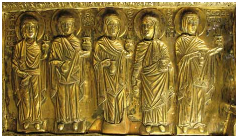
FIG. 8. Formella con le cinque 'Vergini sagge'.