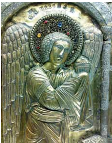
FIG. 11. L'arcangelo Michele.

Mater ecclesiae . 51 Anche la distribuzione delle restanti figure e le connessioni teologiche da esse richiamate pongono la Mater Dei al centro della rappresentazione qualificandola in modo chiaro quale unica mediatrice dei fedeli con Cristo.