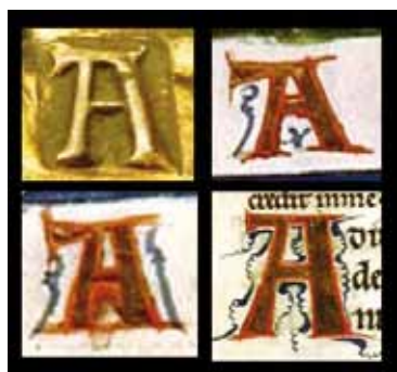
FIG. 3. Confronto tra le lettere punzonate sulla tabula e quelle miniate sul Salterio di S. Elisabetta (cod. CXXXVII – Museo Archeologico di Cividale del Friuli).

La comparazione tra le due opere, la tabula argentea ed il codice miniato, ha interessato alcune lettere solitamente decisive per i con-