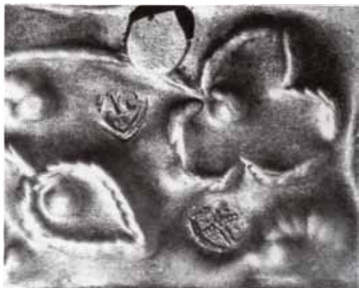
FIG. 6. Punzonature su manufatto argenteo con lettere 'in positivo' (da Oreficeria sacra in Veneto , a cura di A.M. SPIAZZI, fig. 85d).

differenza che i punzoni li utilizzati erano fabbricati con bordi taglienti e non superavano l'altezza di 4 mm. 34 Lipinsky, nel 1986, sottolineò come nessuno storico fino ad allora avesse individuato questa incredibile innovazione tecnica che a suo dire, poteva anticipare di ben due secoli e mezzo il metodo di stampa ideato da Gutenberg. 35 Anche di recente una « équipe di luminari tedeschi» ha voluto ribadire, «senza ombre di dubbi», che l'opera cividalese rappresenterebbe un'innovazione incredibile per l'epoca ed anticiperebbe clamorosamente l'invenzione dei caratteri mobili. 36 In realtà, pur encomiando la capacità inventiva di questi aurifices , si può risolvere l'arcano delle iscrizioni cividalesi senza scomodare il tipografo di Magonza e le sue innovazioni tecniche. 37