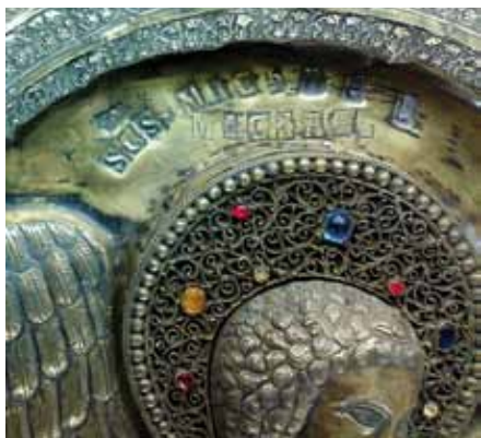
FIG. 9. Iscrizione dell'arcangelo Michele.