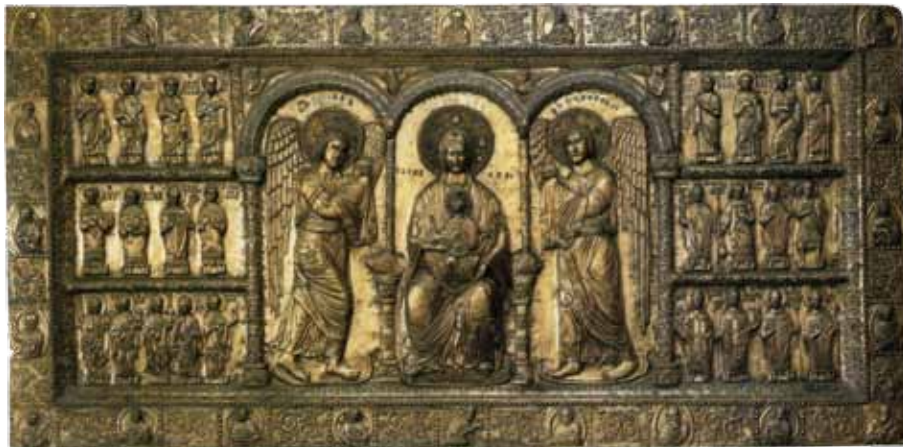
FIG. 1. La 'pala' di Pellegrino II.

Il patrimonio artistico di questa cittadina può vantare ad esempio anche un'opera rara ed importante nel panorama tipologico nazionale ovvero una decorazione d'altare in metallo prezioso tra le poche che ancor oggi si conservano in modo integrale. 1 Si tratta della cosiddetta 'pala' di Pellegrino II (fig. 1), dal nome del patriarca cui è ricondotta la committenza, attualmente collocata entro una teca marmorea posta sull'altare maggiore del duomo cividalese. 2 Il pregiato manu-