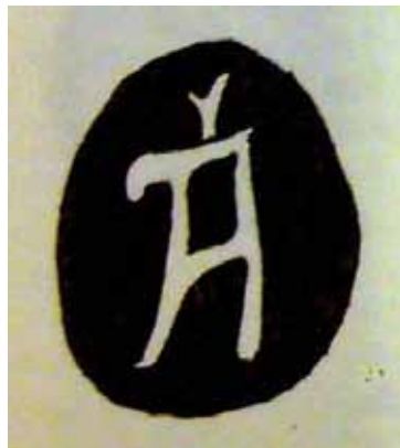
FIG. 7. Riproduzione lettera A punzonata su un argento a Venezia nel XIII secolo (da PAZZI 1992).

È necessario chiarire che questa specifica tecnica presuppone non la semplice presenza di punzoni da incisione, certamente già adoperati in bottega per sbalzare o incidere le iscrizioni, ma testimonia l'esistenza di una serie di punzoni/matrici di diversa grandezza (circa quaranta) realizzati con lettere incise in negativo. 33 Le uniche testimonianze tipologiche avvicinati all'epigrafe cividalese sono quelle realizzate su alcune stauroteche e lipsanoteche bizantine datate tra X e XII secolo, ma con la