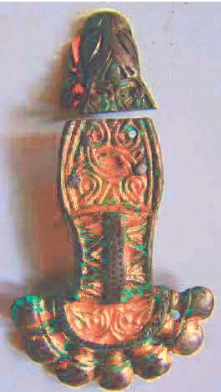
Fig. 3. Romans d'Isonzo (Gorizia). Tomba 327, fibula a staffa tipo Bierbrauer 2 da inumazione di bambina deceduta a età inferiore ai 10 anni [Su concessione della Soprintendenza ABAP FVG - MiC. Ulteriori riproduzioni delle immagini sono regolate dalla vigente normativa (art. 108 co. 3 del D. Lgs 42/2004 s.m.i. - DM 161/23) e ne è vietata l'ulteriore riproduzione a scopo di lucro].