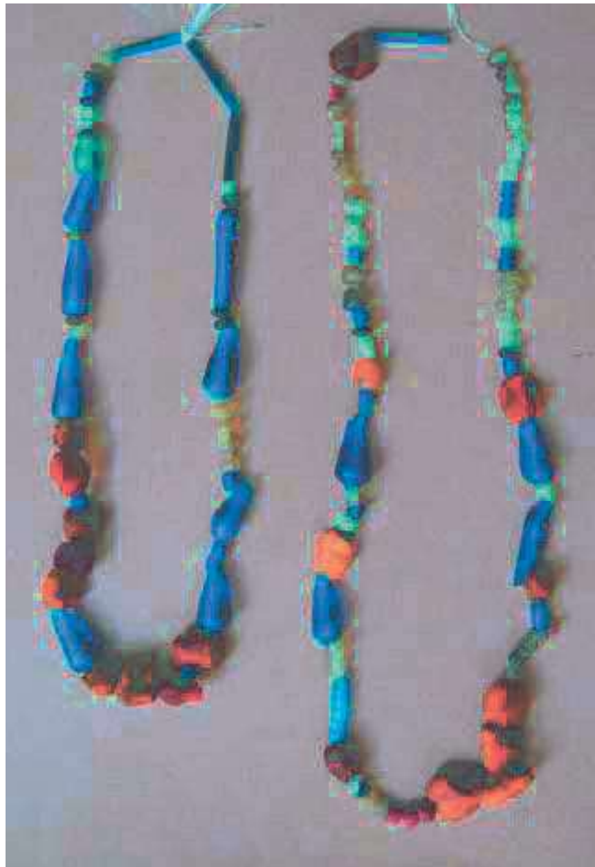
Fig. 4. Romans d'Isonzo (Gorizia). Tomba 327, due collane composte prevalentemente da vaghi vitrei di colore blu, [Su concessione della Soprintendenza ABAP FVG - MiC. Ulteriori riproduzioni delle immagini sono regolate dalla vigente normativa (art. 108 co. 3 del D. Lgs 42/2004 s.m.i. - DM 161/23) e ne è vietata l'ulteriore riproduzione a scopo di lucro].