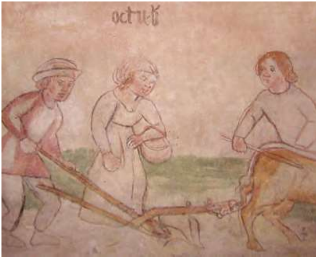
Raffigurazione di ottobre nel quattrocentesco Ciclo dei mesi della chiesa di San Pietro a Magredis di Povoletto in cui appare l'impiego dell'aratro semplice (non dotato di carrello) a struttura radiale nella semina del grano (foto Sonia Casari)

gli aratri dotati di carrello, dall'altro persistevano, magari in famiglie con minori disponibilità finanziarie, quelli più antichi, dotandoli, come vedremo, di particolari accorgimenti che li rendevano quasi in grado di competere con quelli muniti di avantreno (tale fenomeno si ripeté nel periodo tra le ultime due guerre, quando assieme agli aratri in ferro non mancavano, in alcune famiglie, quelli fatti ancora in legno). L'aratro con carrello, come si vedrà, spostando gran parte della fatica dall'uomo sugli animali, consentiva all'operatore di dilatare i tempi di lavoro e quindi di ampliare di fatto la superficie arabile in un giorno, aumentando, in ultima analisi, la produzione agricola in un periodo caratterizzato da un notevole incremento di popolazione. Premesso che in entrambi i casi si tratta di aratri realizzati completamente in legno, fatta eccezione per il vomere ed il coltro che sono in ferro (tale struttura dell'aratro di origine romana permarrà fino alla fine del 1800!), si evidenzia che, analogamente a quanto avviene nell'aratro con carrello a San Lorenzo in cui si palesa il progresso dell'agricoltura in allineamento con quella del vicino Lombardo-Veneto, anche in quello di San Pietro a Magredis, lungi dal rimarcare l'arretratezza per essere senza carrello, si notano elementi innovativi,