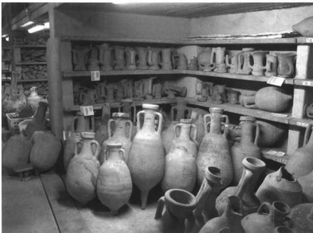
Fig. 3. Aquileia, Museo Archeologico Nazionale, "magazzino delle anfore".

destinati al deposito, o ai depositi, delle anfore (fig. 3), tanto da rendere insufficiente lo spazio dedicato, sicché è stato necessario dislocarle anche in altri fabbricati, senza la possibilità di una distribuzione coerente.