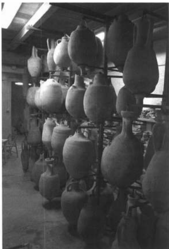
Fig. 1-2. Aquileia, Museo Archeologico Nazionale, "magazzino delle anfore": la sistemazione sugli "alberi" degli anni '60.