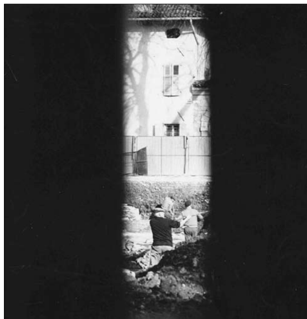
Fig. 2. Come gli Aquileiesi videro gli scavi in Piazza Capitolo (foto Andrian).

Al consiglio dell'Associazione Nazionale per Aquileia la Soprintendente Fogolari l'11 giugno 1971 riferisce "sul grande scavo di piazza Capitolo che ha rivelato ben cinque livelli antichi [due paleocristiani e tre romani dice la stessa all'assemblea generale] sovrapposti; tale scavo andrà conservato visibile sotto soletta. Converterà però nella stagione morta ampliarlo onde poter poi predisporre una copertura più omogenea" 44 . Ai cinque livelli va aggiunto poi quello medievale. Più o meno gli stessi concetti ripete la Soprintendente all'assemblea del 10 giugno 1972. In quell'occasione il Sindaco Andrian chiede che si intervenga in piazza Capitolo con una pavimentazione in porfido 45 .