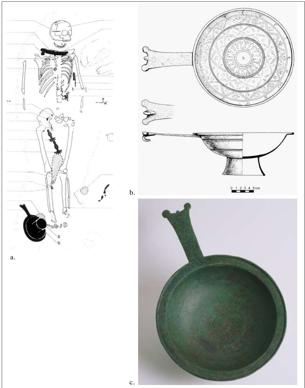
Fig. 3. Necropoli di San Mauro (Cividale del Friuli-UD): a. T21, ultimo trentennio del VI secolo; b.-c. T21, bacile in bronzo con la scritta ΝΙΨΕ ΥΓΙΕΝΩ ΚΙΡ (lavati, stando in buona salute signore) [Museo Archeologico Nazionale di Cividale, inv. 23890] (da COLUSSA 2010).