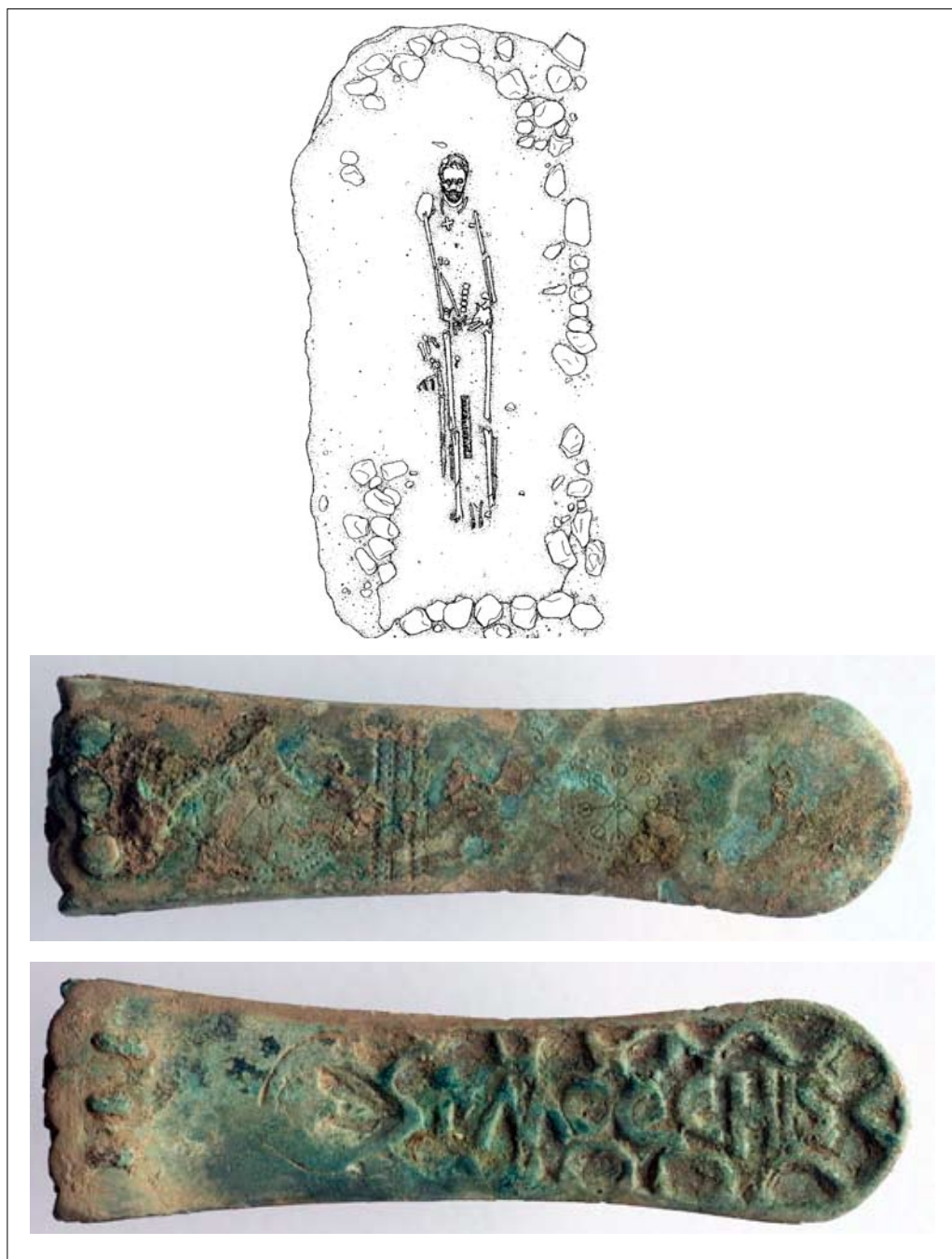
Fig. 1. Necropoli di Lovaria (Pradamano-UD): a. T83, metà del VII secolo (da BUORA, USAI 1997); b. Puntale di cintura in bronzo che sul verso reca l'incisione MOECHIS (Musei Civici di Udine).