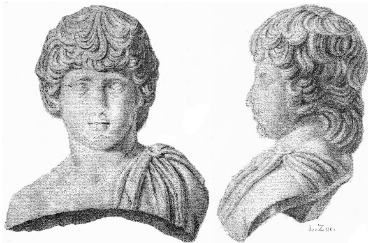
FIG. 3 LEOPOLDO ZUCCOLO: IL DISEGNO DEL BUSTO DI ANTINOO IN VISIONE FRONTALE E LATERALE.

A sua volta, è stata ipotizzata la vicinanza, dalle sfumature cultuali, fra gli edifici dedicati ad Esculapio e Beleno, in base alla localizzazione lungo la via Giulia Augusta, fondo cosiddetto Rosin (part. cat. 598/24), del tempio di quest'ultimo 69 (tav. A). Qui, infatti, nell'inverno 1893–1894 venne messa in luce parte di un edificio con vano quadrangolare con absidi a Nord e a