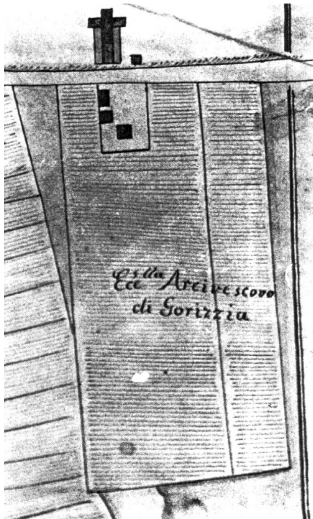
FIG. 4 PARTICOLARE DELLA CARTA TOPOGRAFICA REDATTA NEL 1760 DAL GEOMETRA ANTONIO PADOAN: UBICAZIONE DELL'ABBZIA DI S. MARTINO NEL PUNTO PIÙ ELEVATO DELLA BELIGNA (DA BUORA 1979).

Già i ritrovamenti d'epoca sembrano descrivere una peculiare presenza di tombe con elementi fortemente caratterizzanti, come indicano sia ritrovamenti di bare